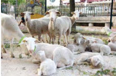
Coup d'envoi des marchés de producteurs sur l'Esplanade.