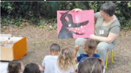
Partir en Livres. La bibliothèque hors des murs. Atelier BD, lecture et vente de livres au jardin de la salle des fêtes.