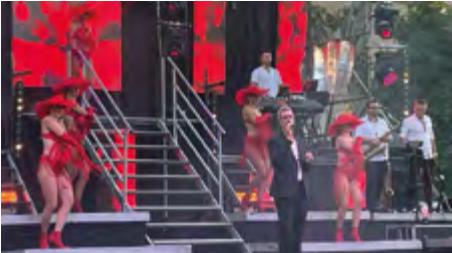
Beau succès pour la traditionnelle Fête votive organisée par un nouveau Comité des fêtes et le Club Taurin.