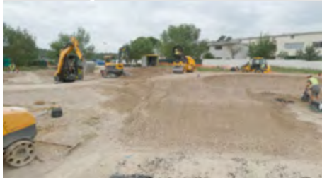
Coup d'envoi des travaux du Pumptrack !