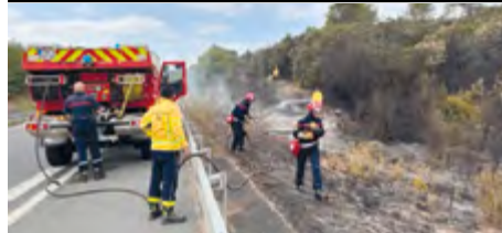
Départ de feu maîtrisé sur l'A750.