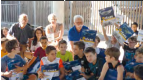
Traditionnelle remise de livres par la municipalité aux élèves des écoles maternelle et élémentaire.