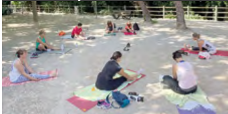
Pour la 1 ère fois la Municipalité propose les « Réveils montarnéens » : Yoga, Body Taekwondo, Boxe anglaise et Zumba !