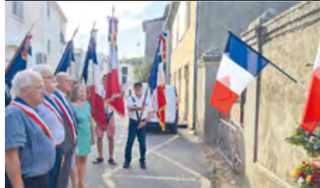
Cérémonie commune de commémoration des victimes du 24 août 1944 à Grabels et Montarnaud, en présence du Maire de Grabels, du président de l'association des Anciens Combattants, de la présidente de l'association ANACR.