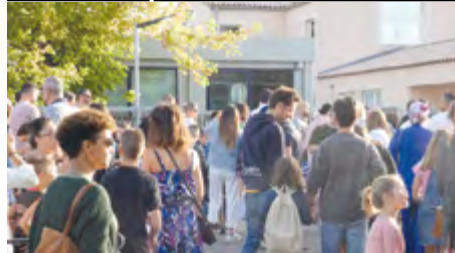
Rentrée scolaire pour 610 enfants Montarnéens.