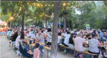
Coup d'envoi des Estivales, jusqu'au 25 août.