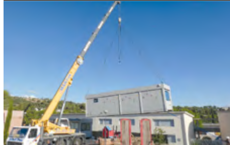
Enlèvement du préfabriqué de la maternelle.