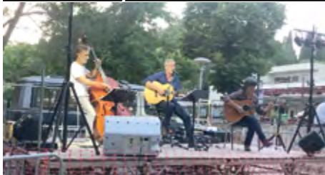
Fête de la musique

Merci pour votre présence et merci à la brasserie et à la cave de Montarnaud pour leur participation à cette belle fête.